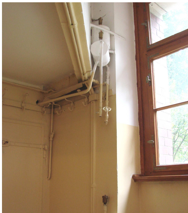
Fot. 33. Instalacje c.o. do likwidacji