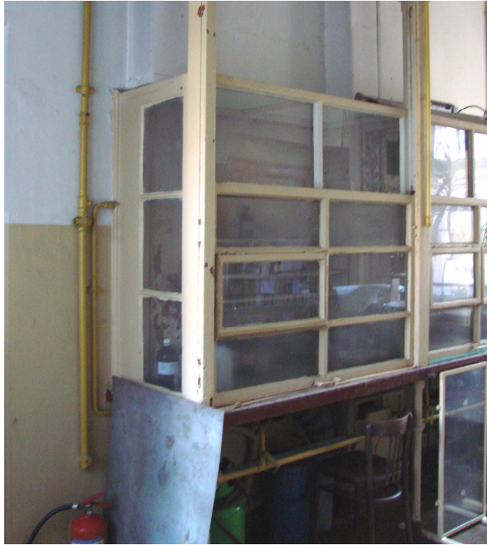
Fot. 1. Digestorium w sali przygotowania pokazów