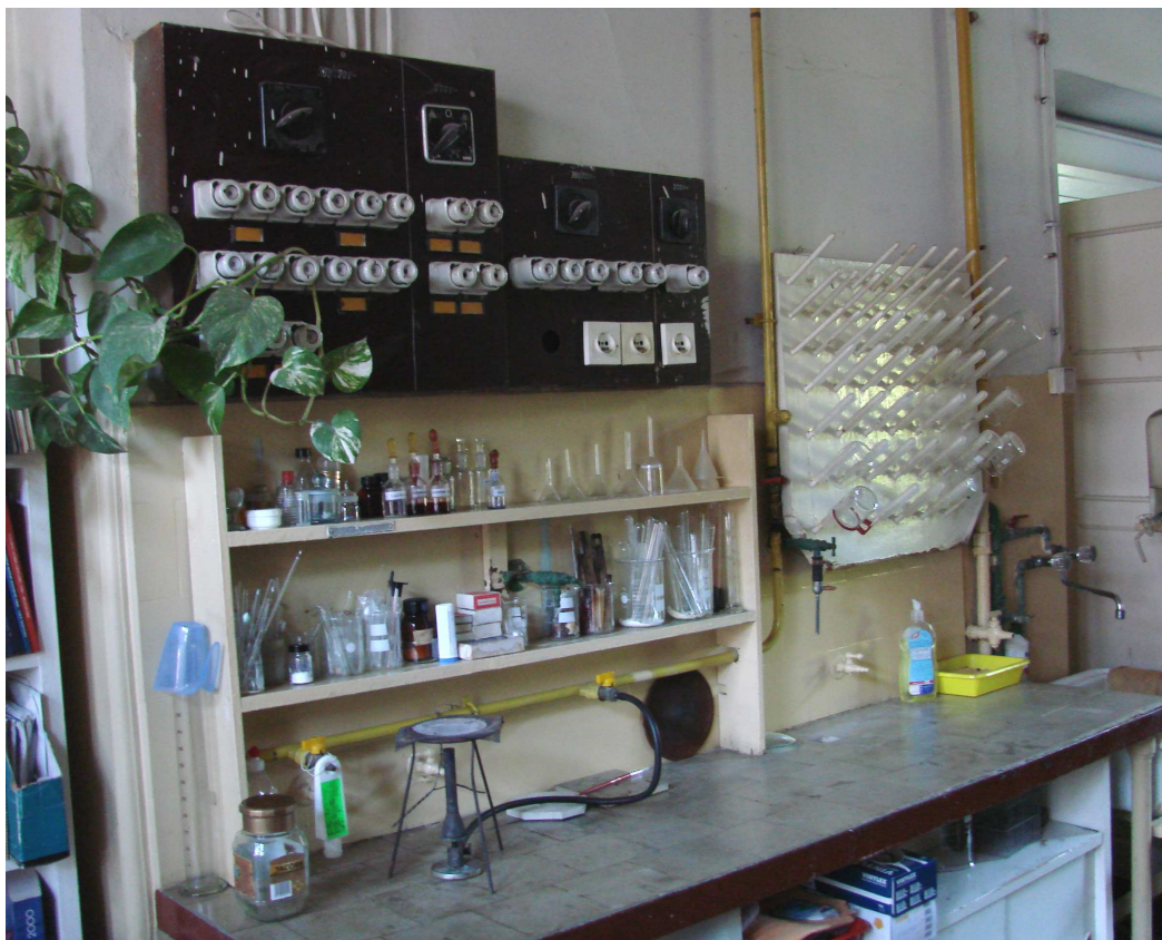
Fot. 6. Stół laboratoryjny i tablica elektryczna