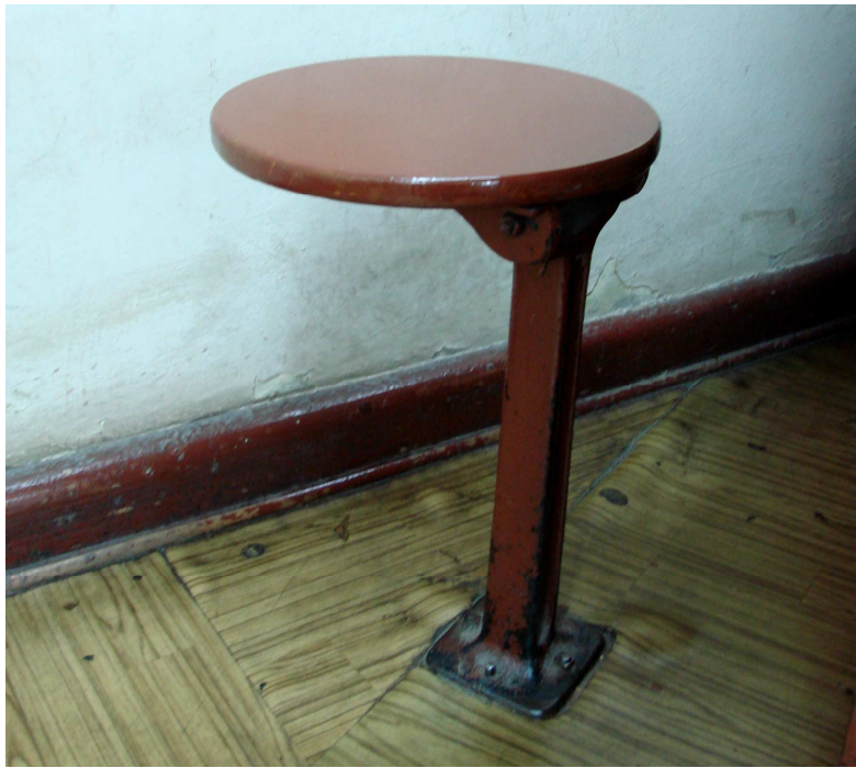
Fot. 25. Siedzisko okrągłe bez zaplecka (do odtworzenia)