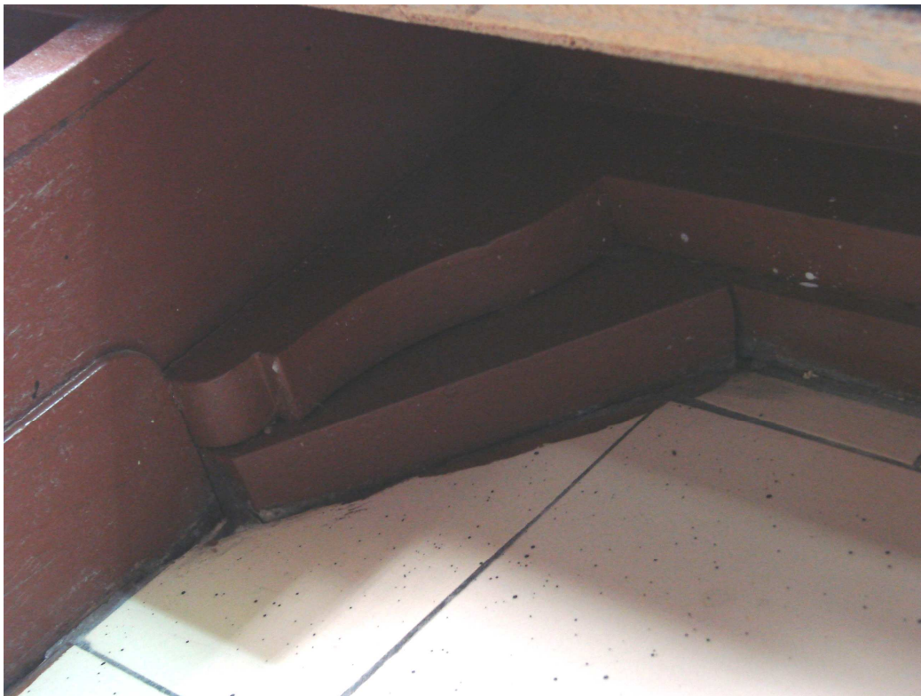
Fot. 15. Ściana czołowa – zachowany profil przyścienny regału potrójnego