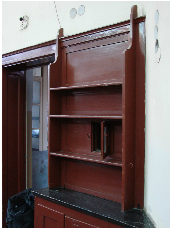
Fot. 7a. Regał pojedynczy