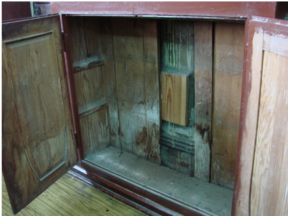
Fot. 13. Ściana czołowa – szafka regału potrójnego; wewnątrz