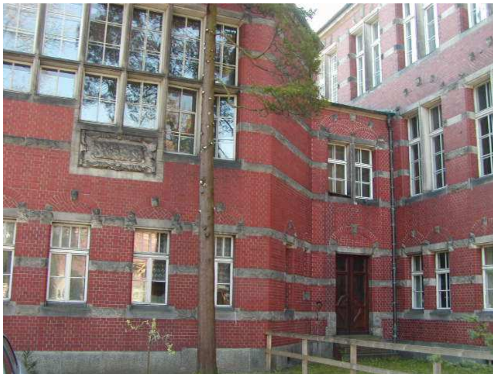
Fot. 42. Elewacja zachodnia (z łącznikiem)