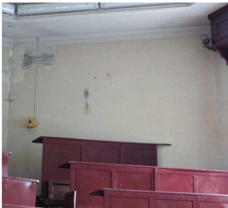
Fot. 23. Fragment malowidła ściennego