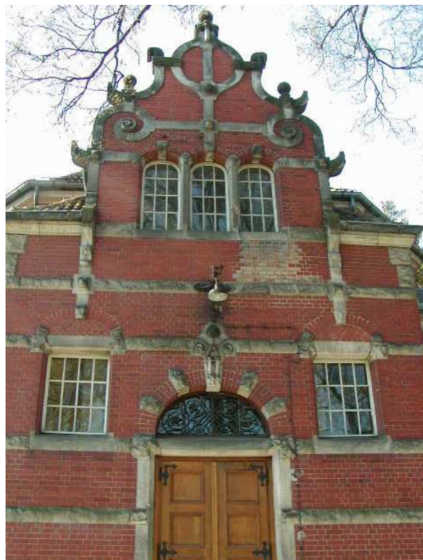
Fot. 41. Elewacja północna