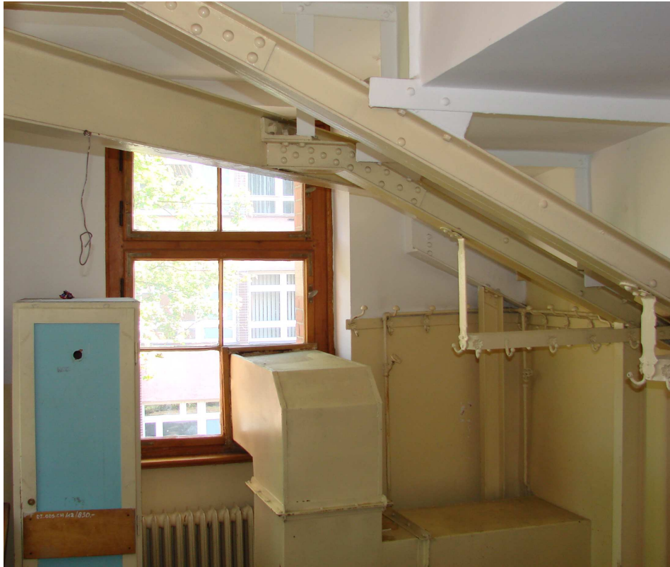
Fot. 34. Kanał wentylacyjny w oknie (do likwidacji)