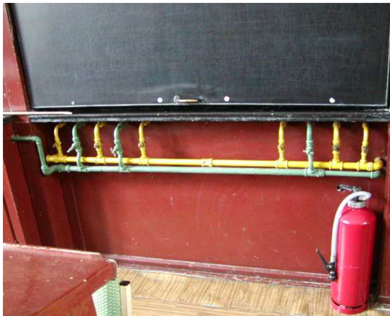
Fot. 9. Ściana czołowa – instalacje do zachowania