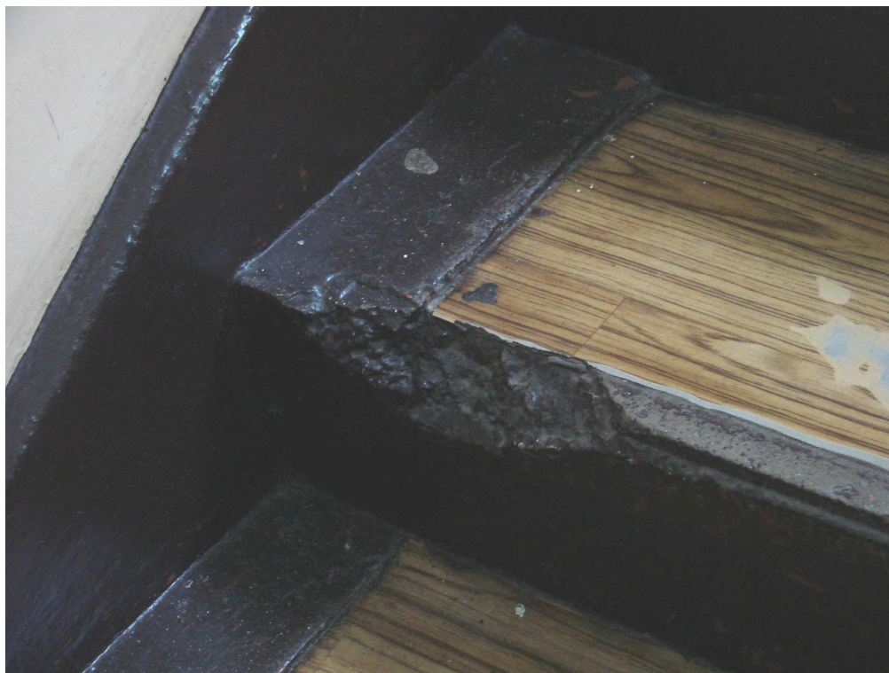
Fot. 29. Uszkodzenie stopnia schodów