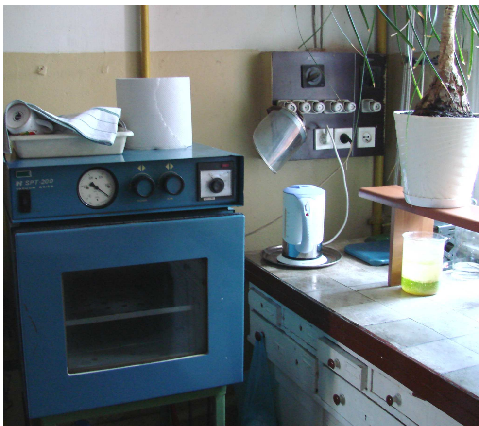
Fot. 4. Stół laboratoryjny pod oknem i tablica elektryczna