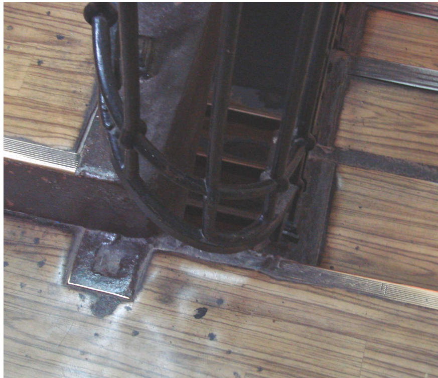
Fot. 32. Ubytek opaski betonowej