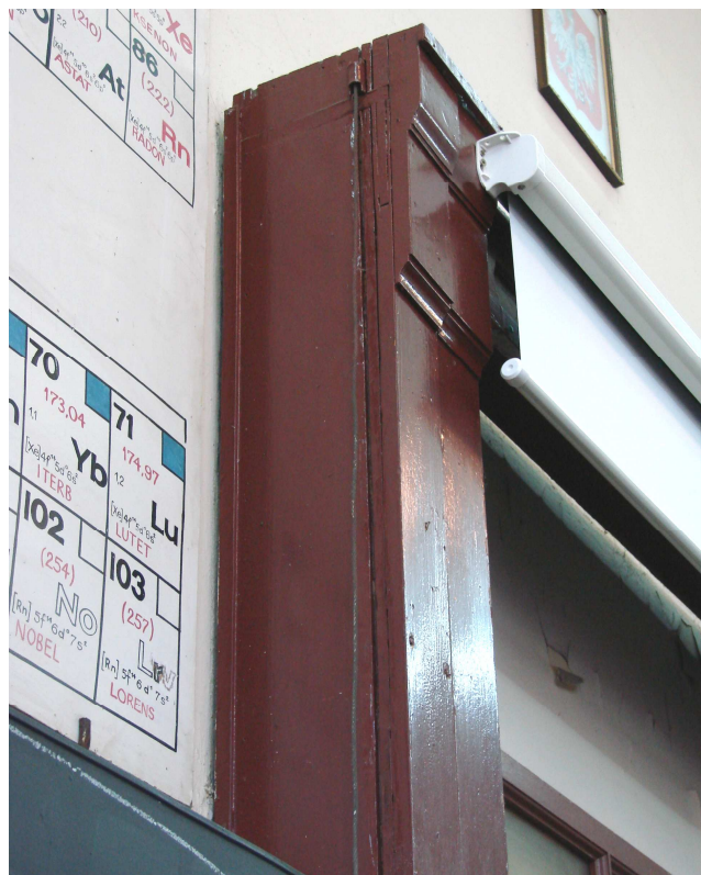
Fot. 16. Ściana czołowa – element konstrukcji nośnej tablic