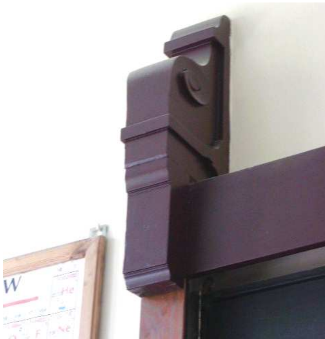
Fot. 19. Ściana czołowa – głowica elementu konstrukcyjnego tablic – widok z prawej (wzór do odtworzenia)