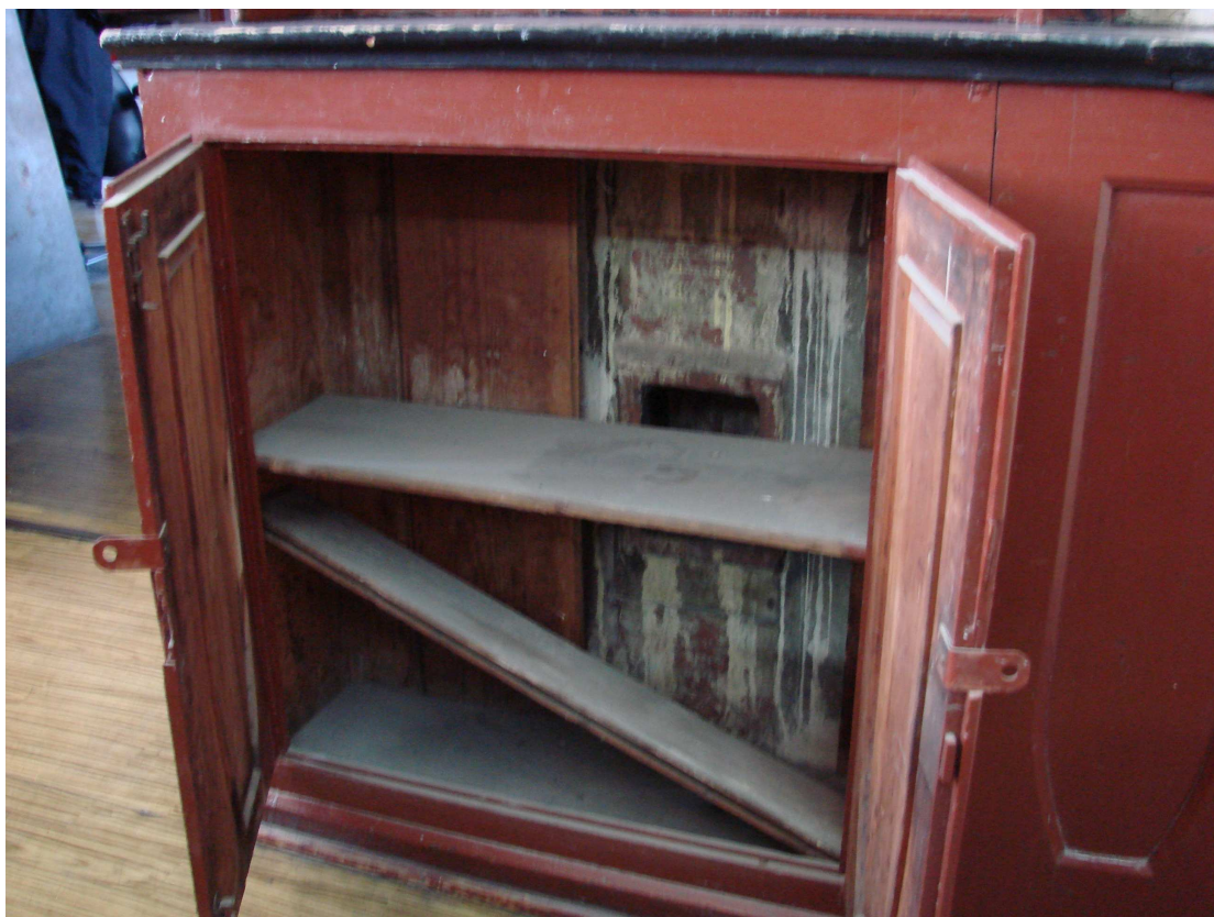
Fot. 7c. Szafka regału pojedynczego z wlotem kanału wentylacyjnego