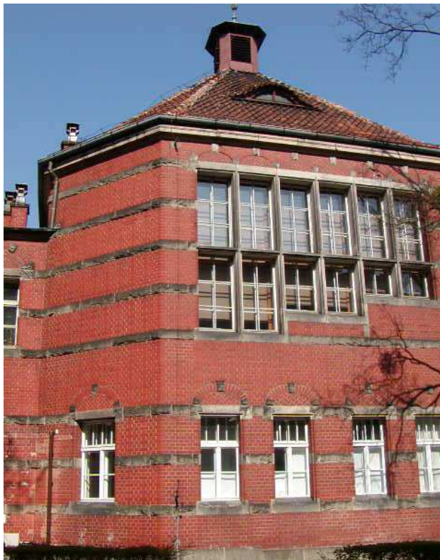
Fot. 40. Elewacja wschodnia