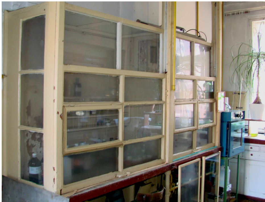
Fot. 2. Digestorium w Sali przygotowania pokazów