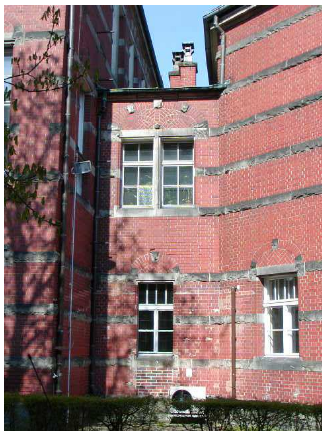
Fot. 43. Elewacja wschodnia - łącznik