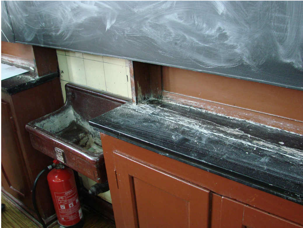
Fot. 14. Ściana czołowa – zlew i szafki regału potrójnego