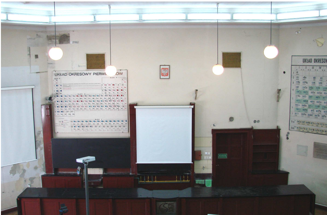
Fot. 7. Widok ogólny ściany czołowej