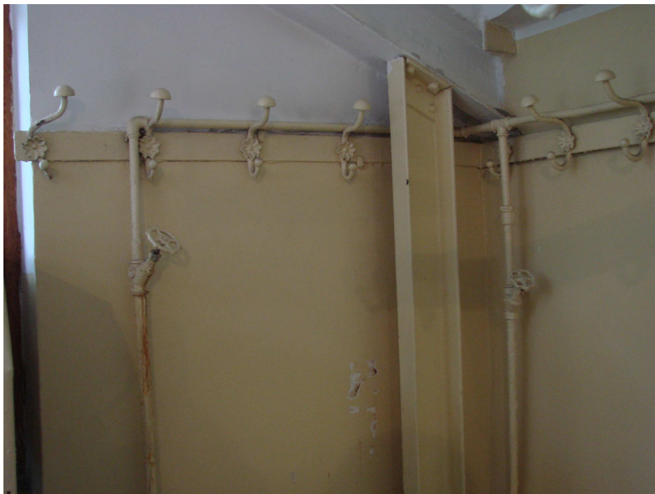
Fot. 35. Wieszaki w szatni do renowacji i odtworzenia; rury do likwidacji