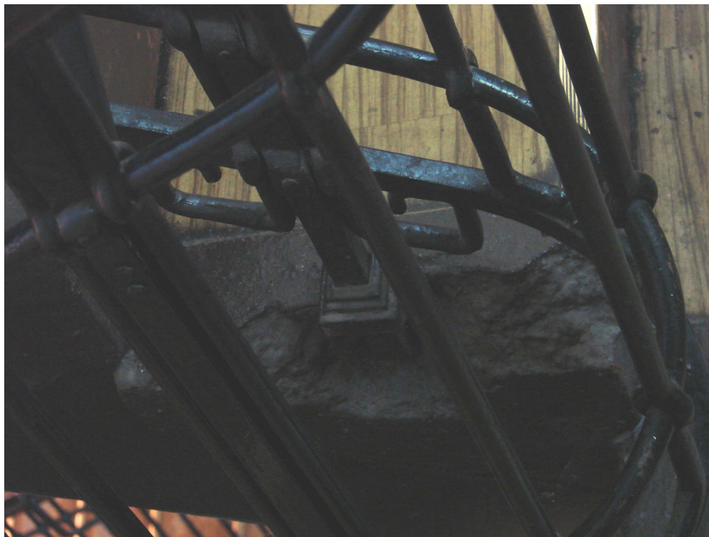
Fot. 28. Uszkodzenie belki policykowej schodów