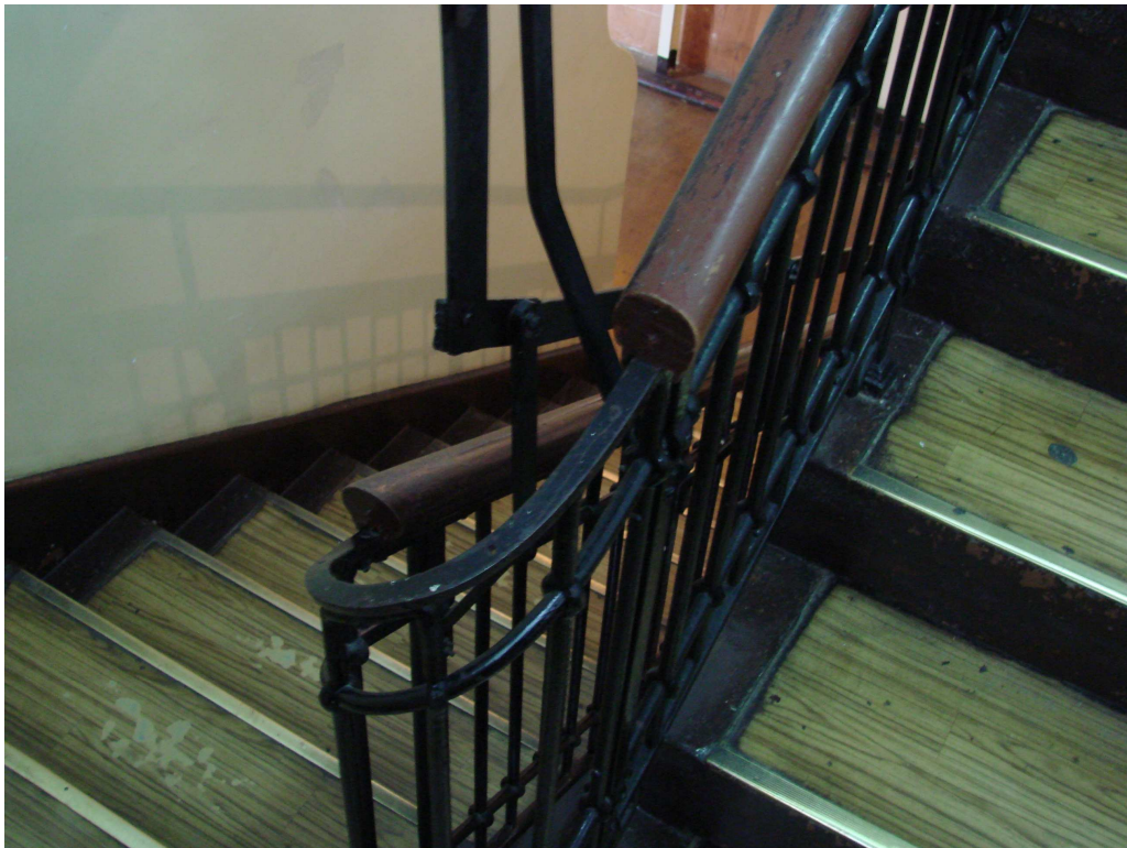
Fot. 31. Ubytek drewnianej poręczy