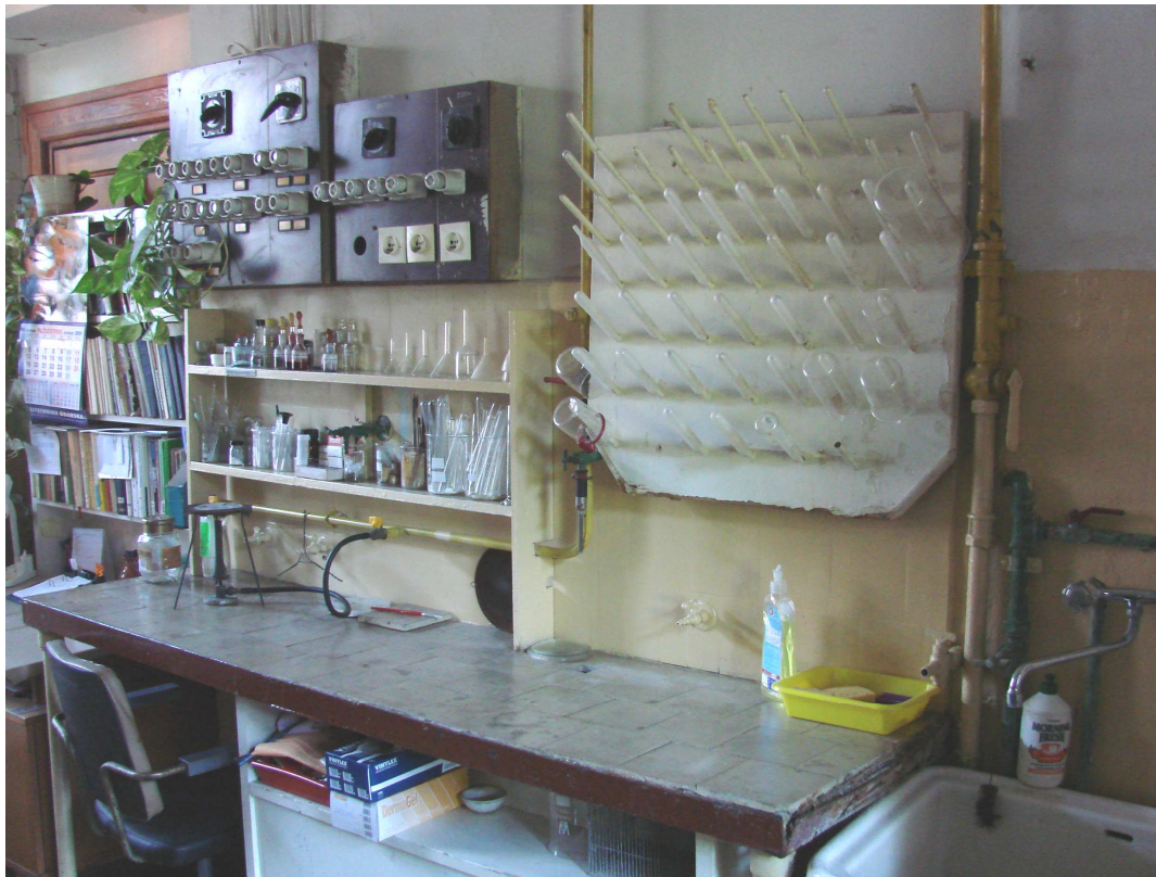
Fot. 5. Stół laboratoryjny i tablica elektr. Płytki ściennie zamalowane farbą