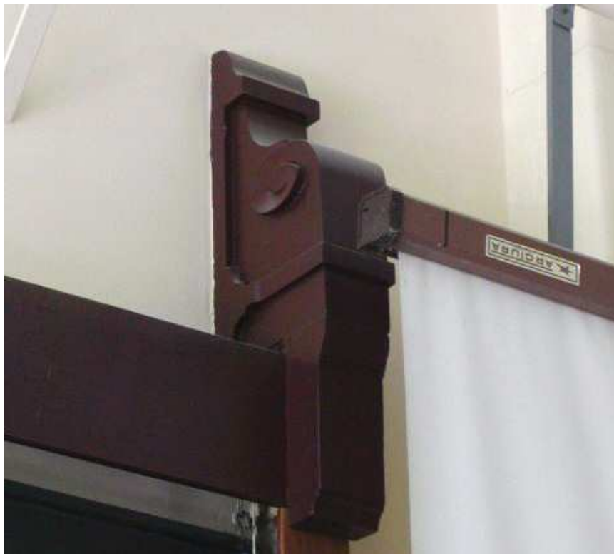
Fot. 20. Ściana czołowa – głowica elementu konstrukcyjnego tablic – widok z lewej (wzór do odtworzenia)