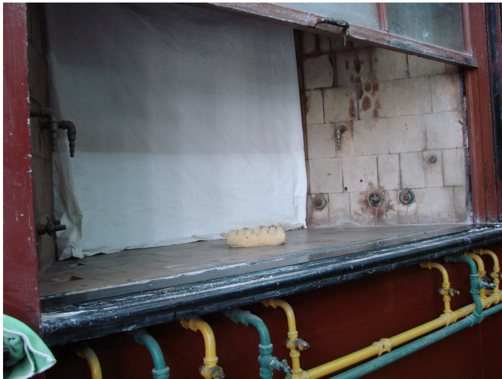
Fot. 10. Ściana czołowa - digestorium