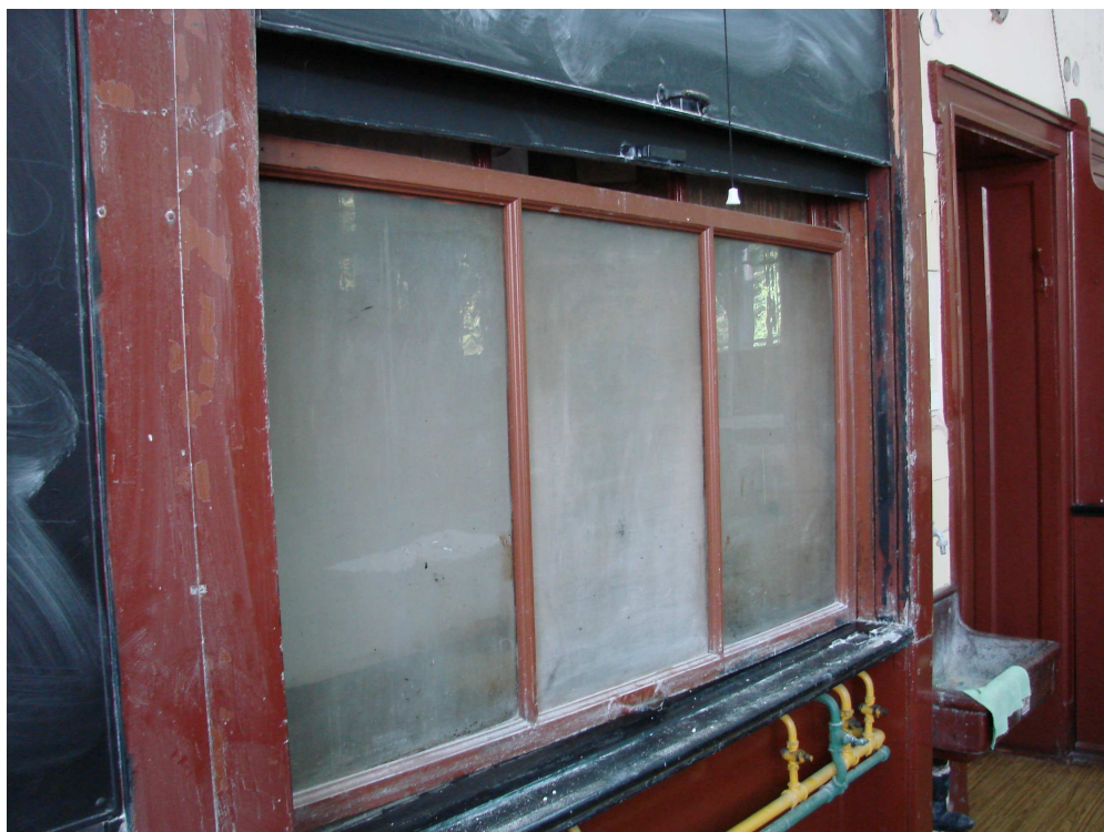
Fot. 11. Ściana czołowa – zamknięcie digestorium