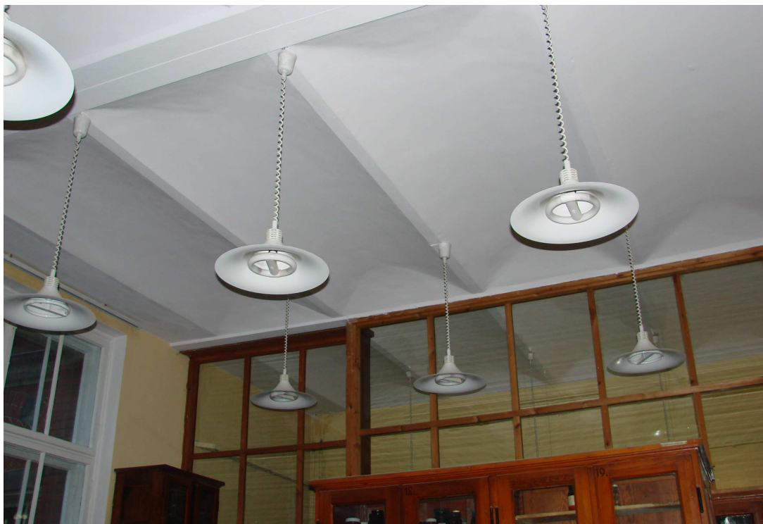
Fot. 38. Ścianka oddzielająca salę od korytarza - do wymiany