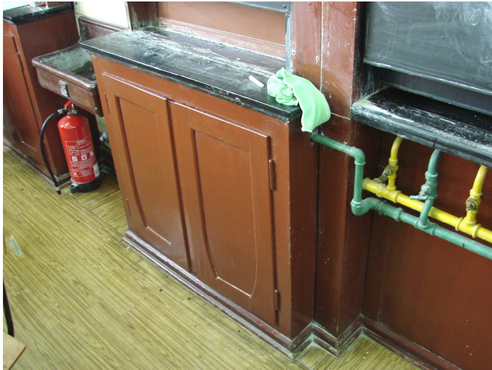
Fot. 12. Ściana czołowa – szafka regału potrójnego z zewnątrz