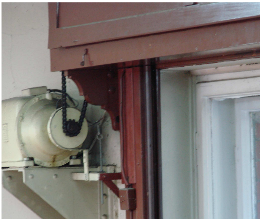
Fot. 21. Skrzynka rolet okiennych z napędem