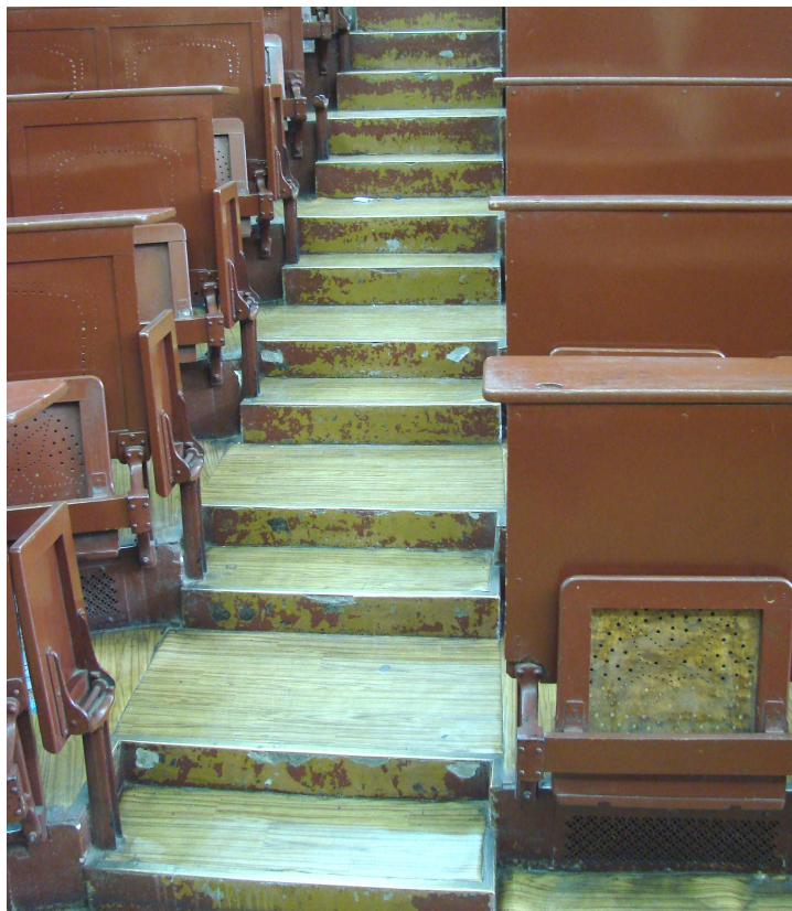
Fot. 22. Schody, pulpity, siedziska i zaplecki