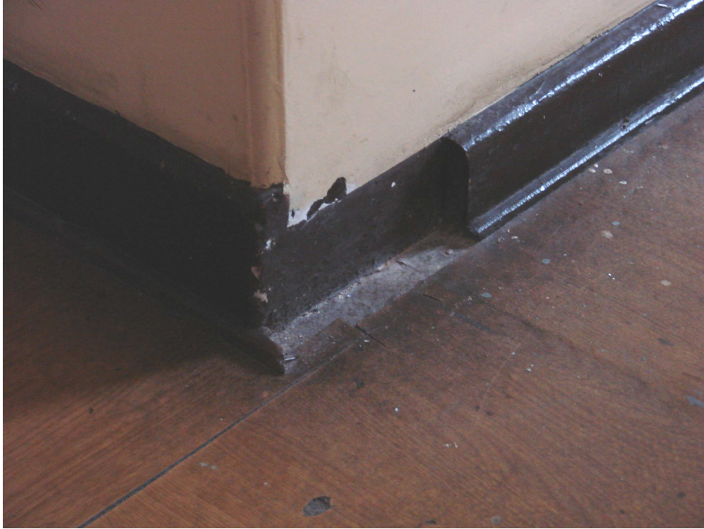
Fot. 30. Ubytek cokołu na antresoli