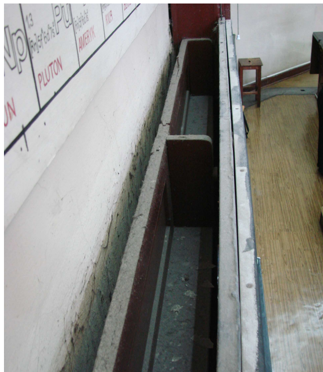
Fot. 17. Ściana czołowa – widok z góry regału potrójnego i tablic