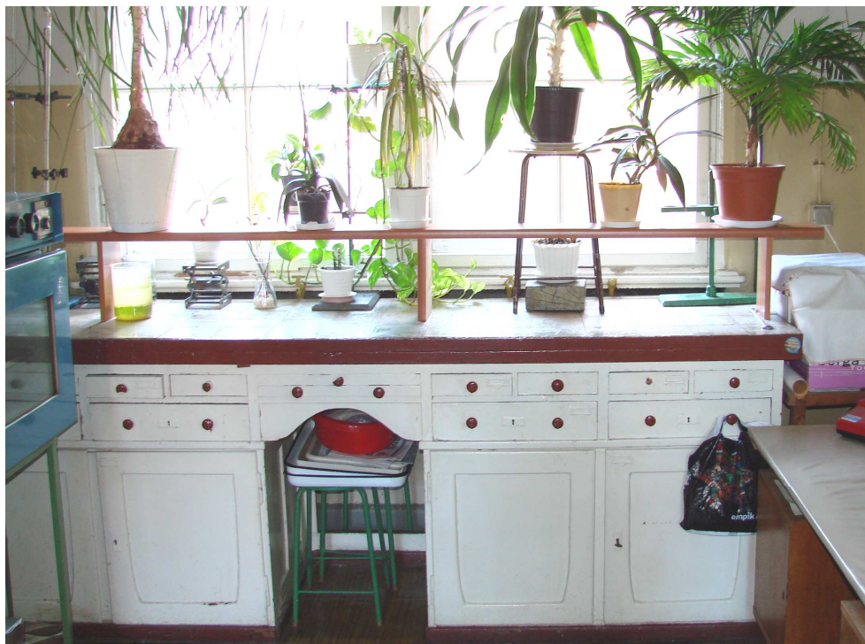
Fot. 3. Stół laboratoryjny z szafkami – pod oknem