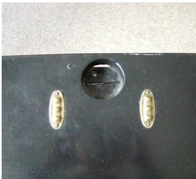
Fot. 27. Podkładki do piór na pulpitych (wzór do odtworzenia)