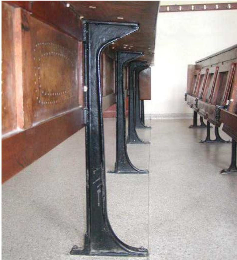
Fot. 24. Noga pulpitu (do odtworzenia)