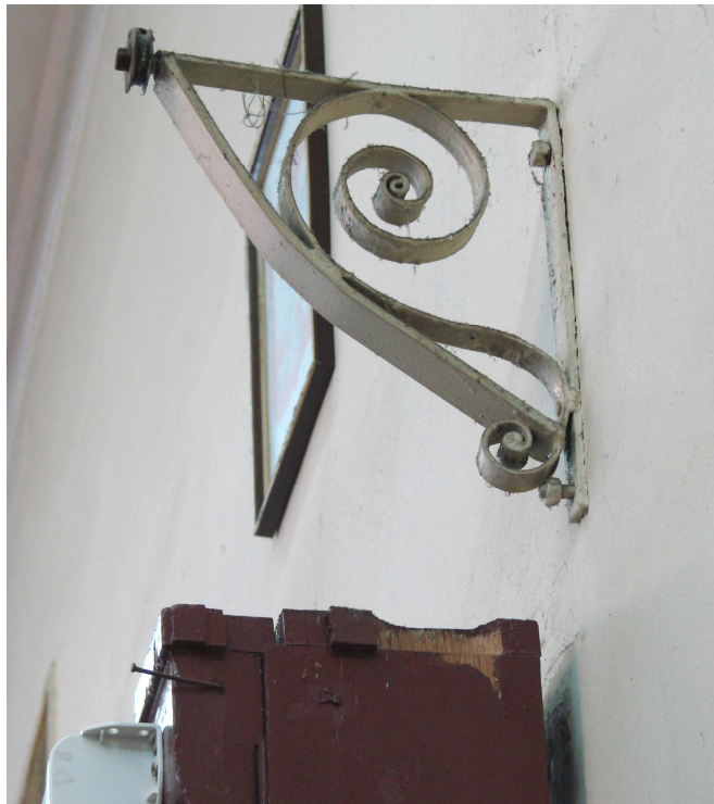
Fot.18. Ściana czołowa – ozdobny metalowy wspornik