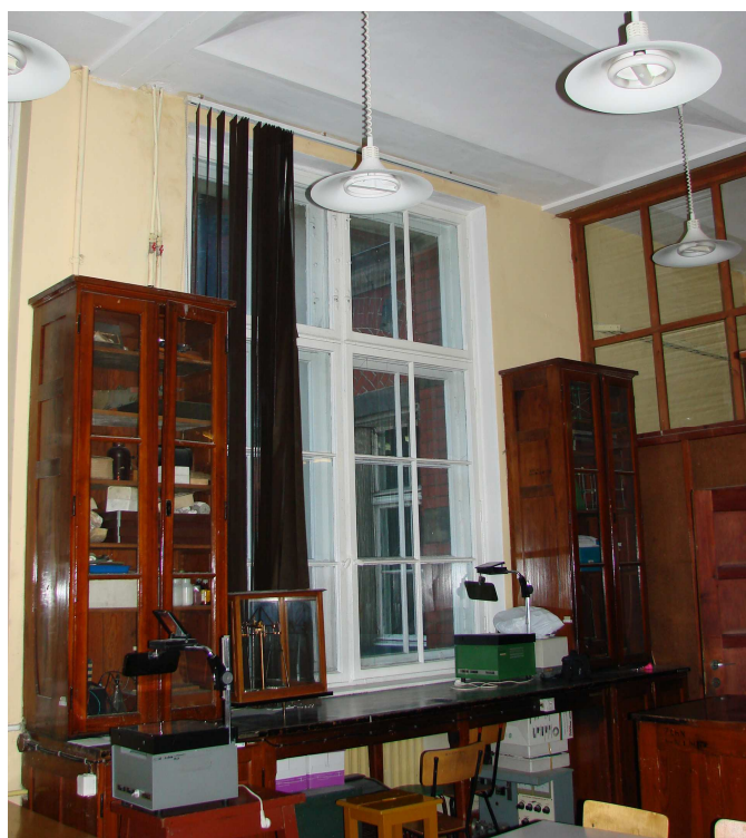
Fot. 39. Ścianka oddzielająca do wymiany; regaly do renowacji