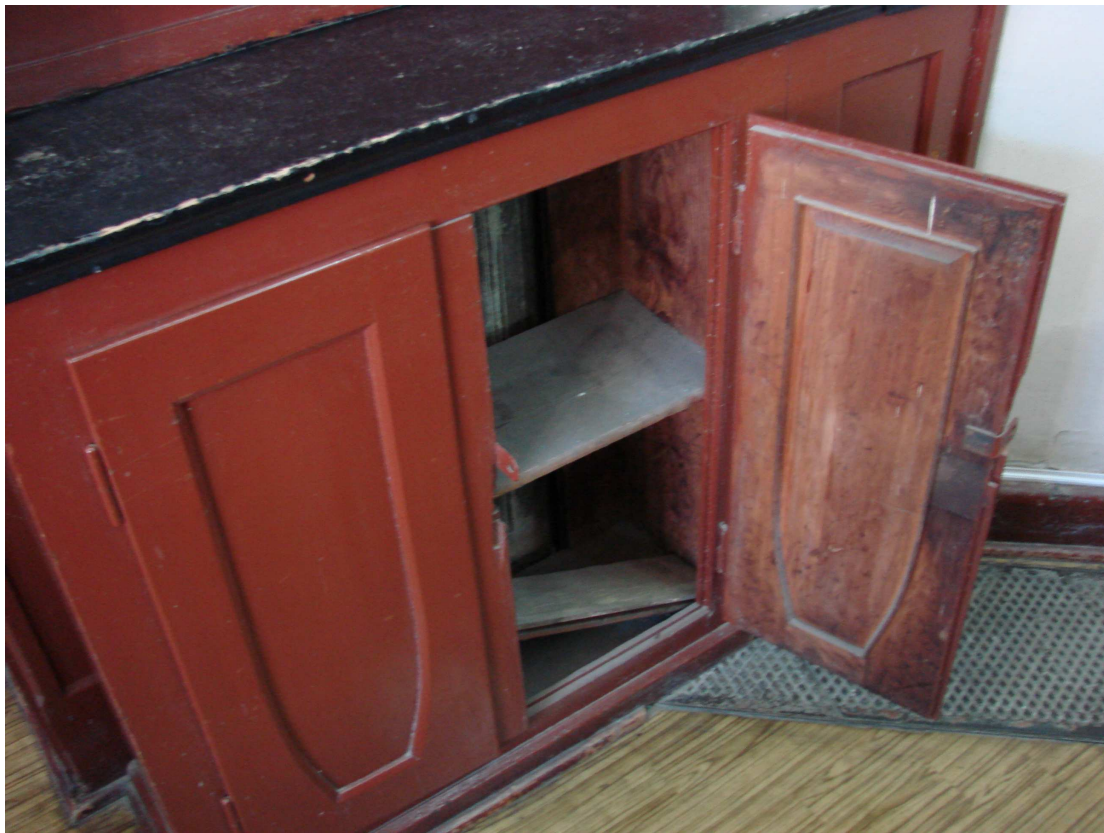
Fot. 7b. Szafka regału pojedynczego i fragment podłogi