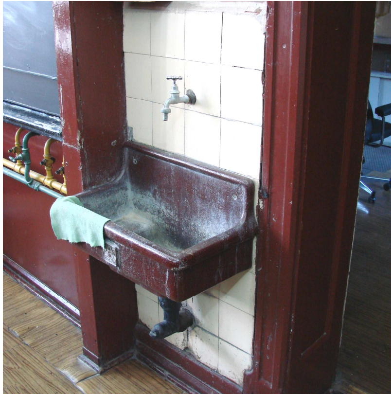
Fot. 8. Ściana czołowa - zlew