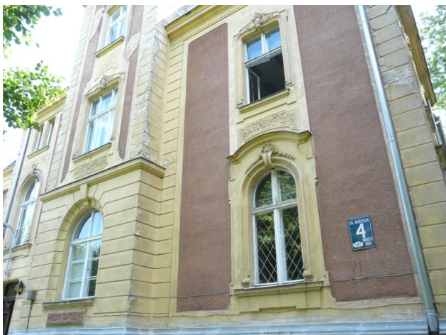
Elewacja nr 3