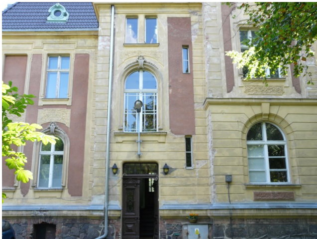
Elewacja nr 1