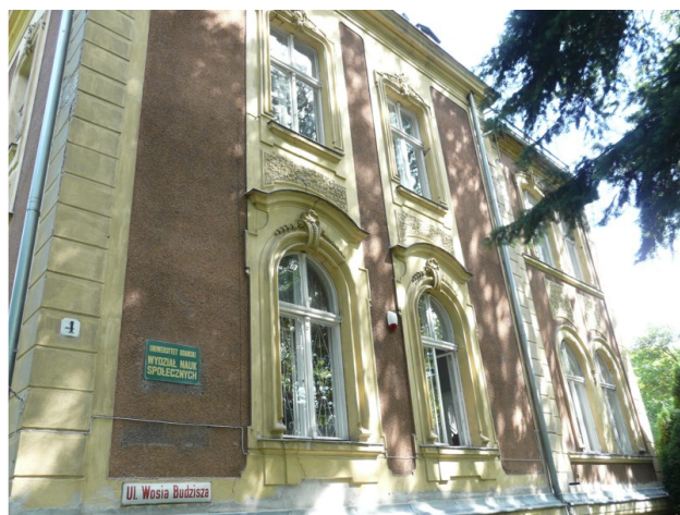
Elewacja nr 2