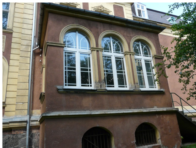
Elewacja nr 4