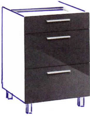
Poz. 1 szafka A- 5 szt. ( Rys. 4.1)