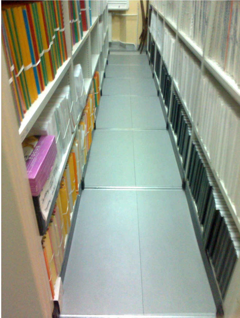
Rysunek nr 4 – podłoga własna regałów