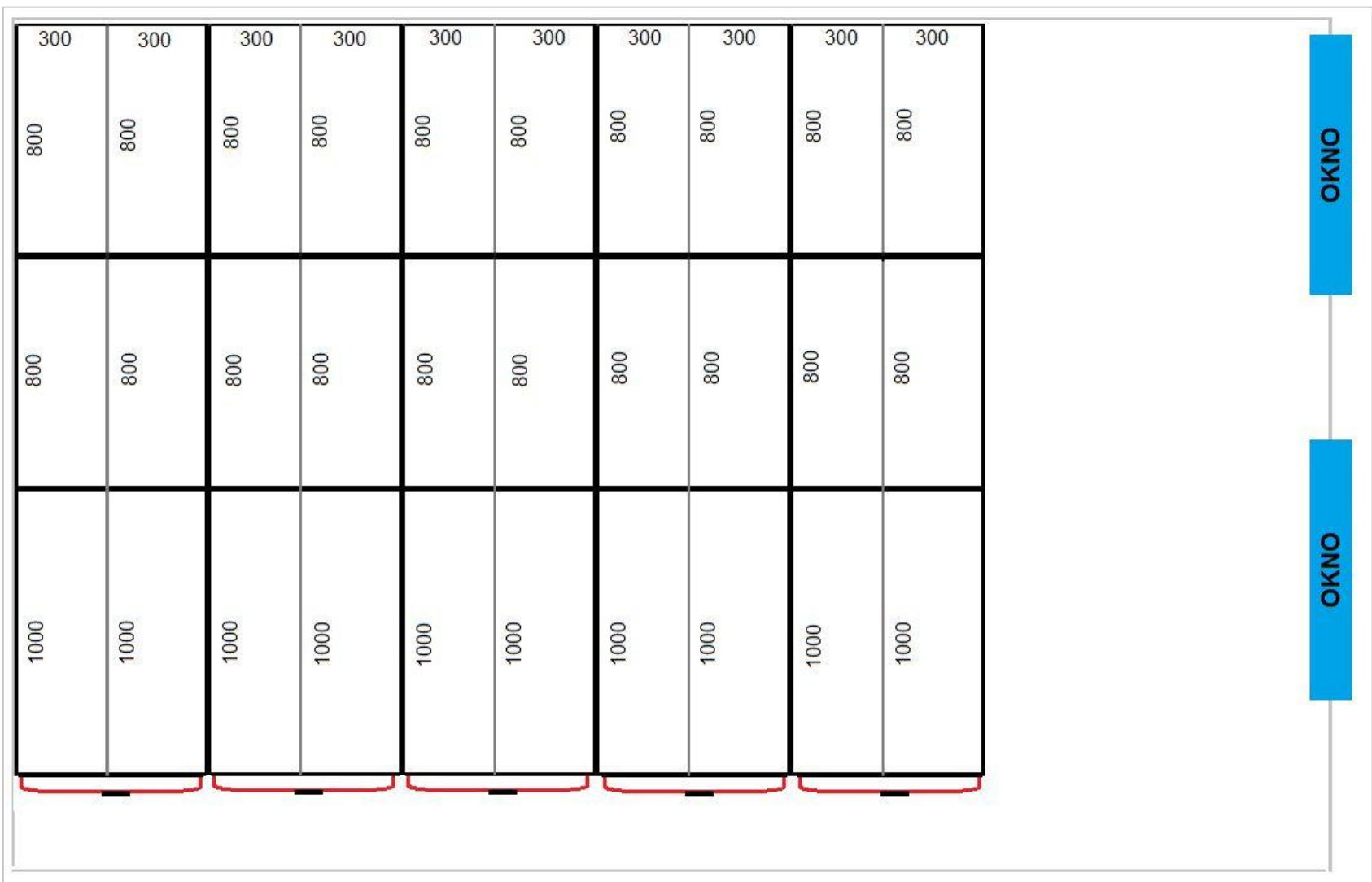
Rysunek nr 1 – regały przesuwne elektryczne. Powyższe wartości zostały wyrażone w milimetrach.