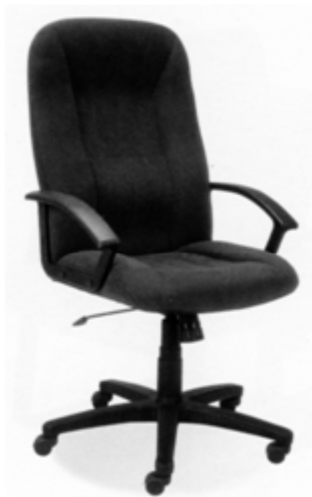
Poz.3 i 4